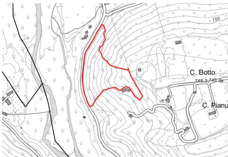
Localizzazione del lotto (si rimanda al capitolato d'oneri per il dettaglio cartografico)

Il lotto sopraindicato costituisce un unico lotto di vendita.