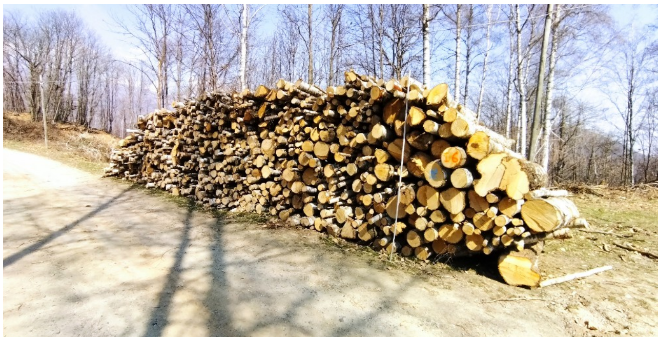
Lotto 16 – Betulla da ardere