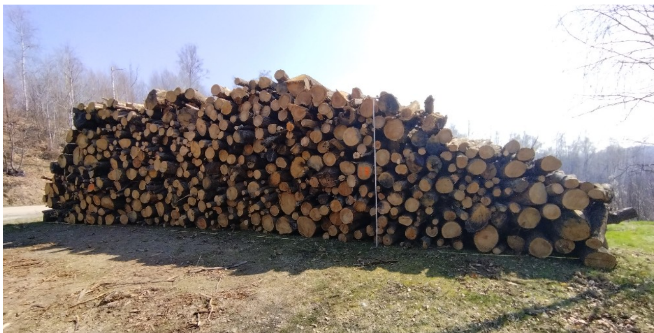
Lotto 18 – Castagno da tannino