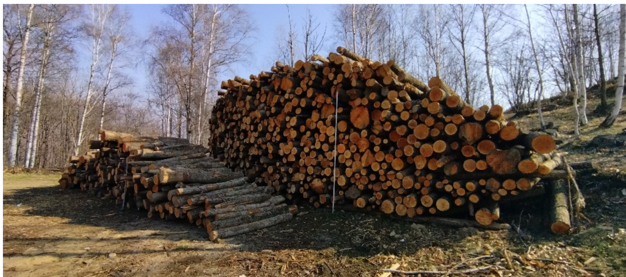
Lotto 15 – Ontano da ardere (due cataste)

N.B. L'asta ripresa nelle fotografie misura 3 m di lunghezza