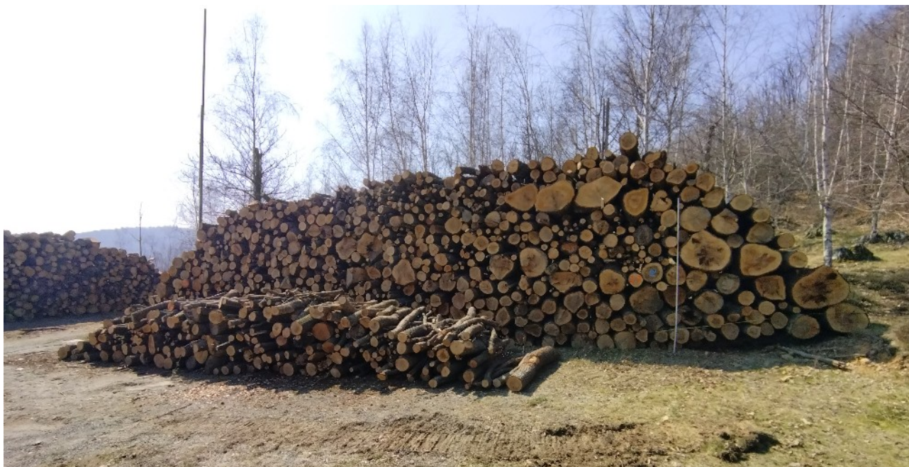
Lotto 17 – Cerro da ardere (due cataste)