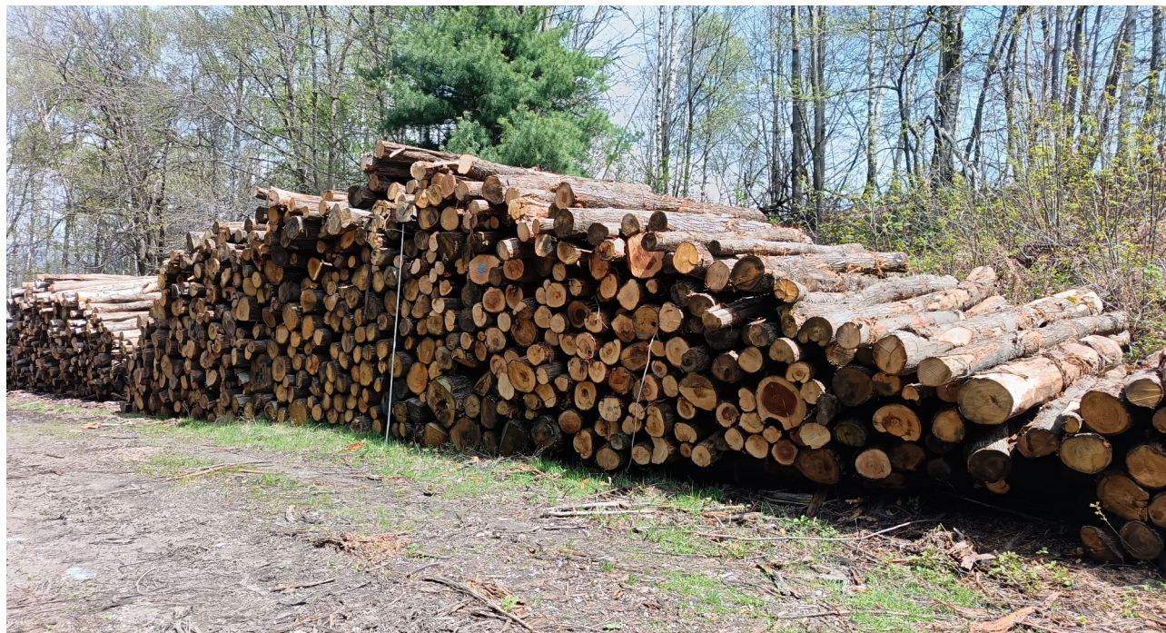
Lotto 4 – Castagno da ardere

L'asta graduata presente nelle foto misura 3 m.